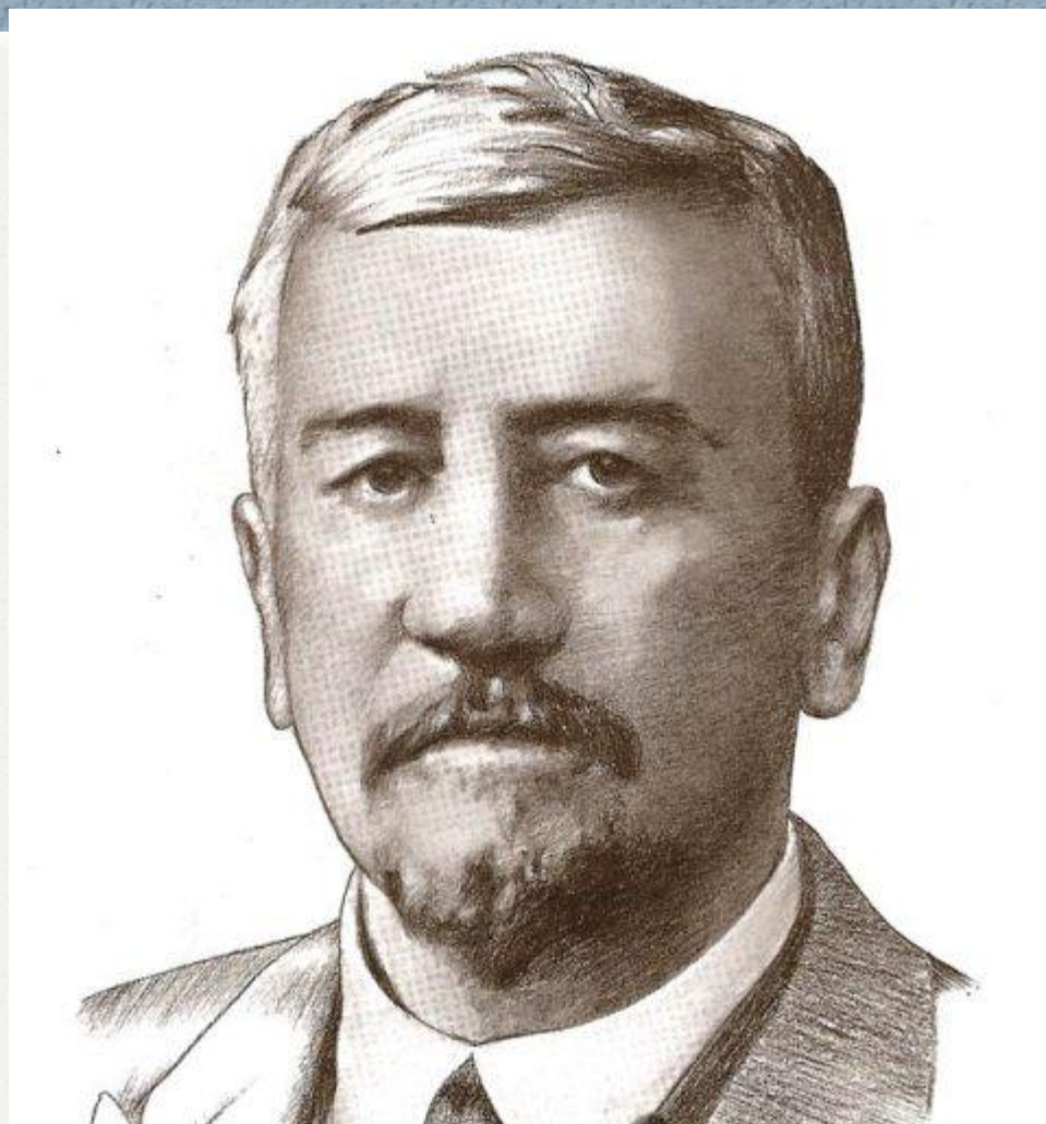
Александр Иванович Куприн (1870 – 1934)