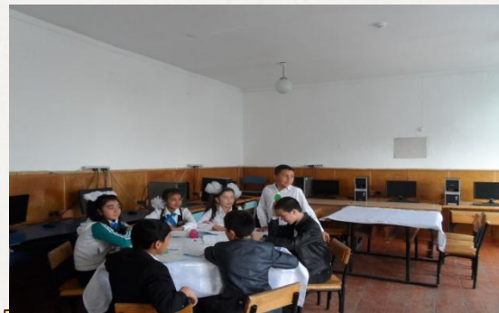
Жас ерекшеліктеріне сәйкес оқыту