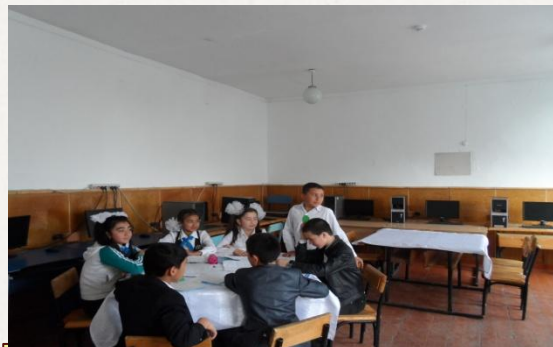
Жас ерекшеліктеріне сәйкес оқыту