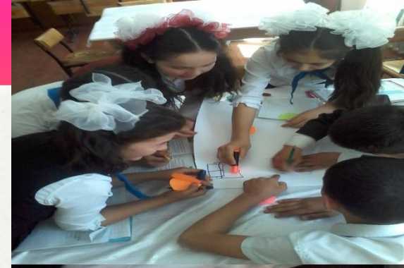
Постер жасау барысы