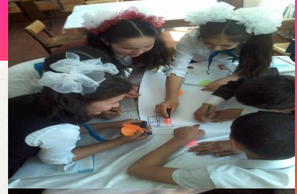
Постер жасау барысы