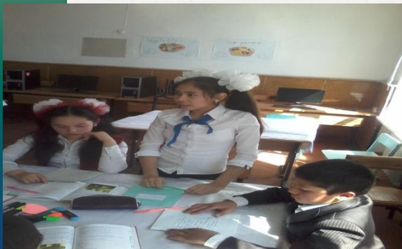
Дарынды балалармен жұмыс