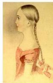
Старшая дочь, Мария (1832-1919г.)

У А.С.Пушкина и Натальи Гончаровой было четверо детей.