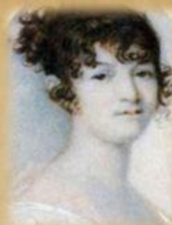
Мать, Надежда Осиповна Пушкина (урожденная Ганнибал)