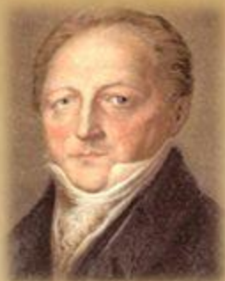
Отец, Сергей Львович Пушкин