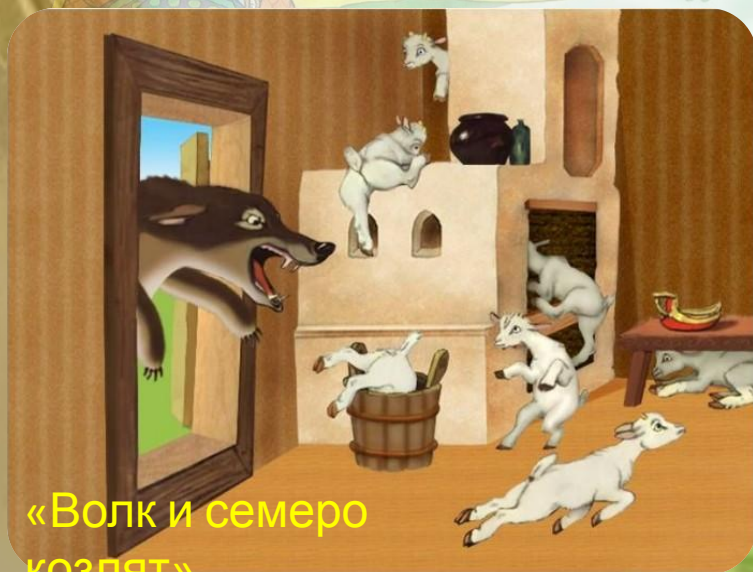
«Волк и семеро козлят».