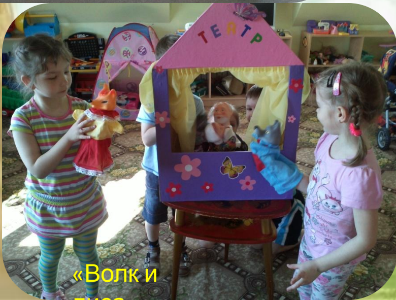
«Волк и ягненок»