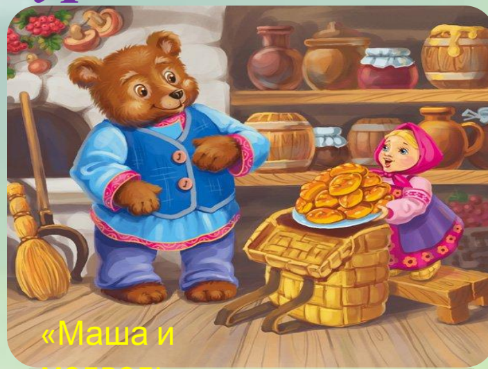
«Маша и медведь»