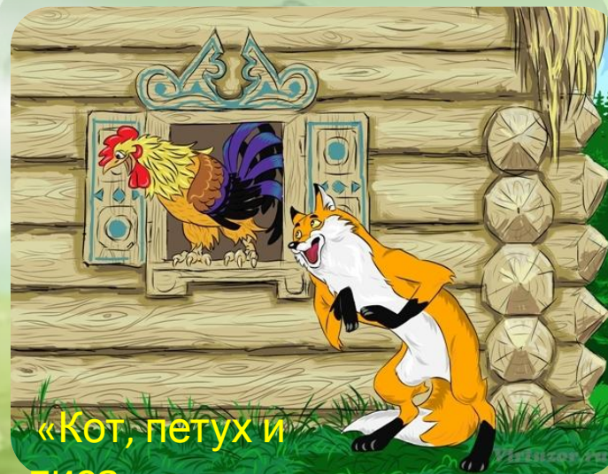
«Кот, петух и лиса»