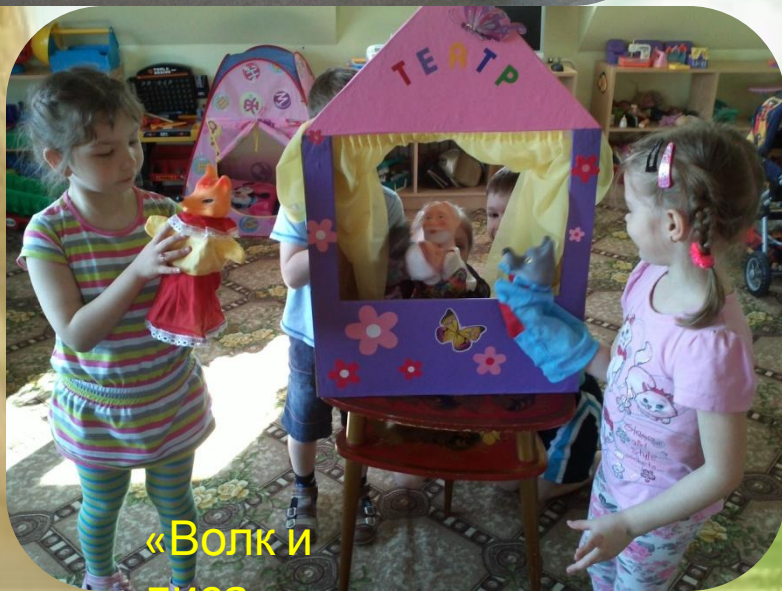
«Волк и »