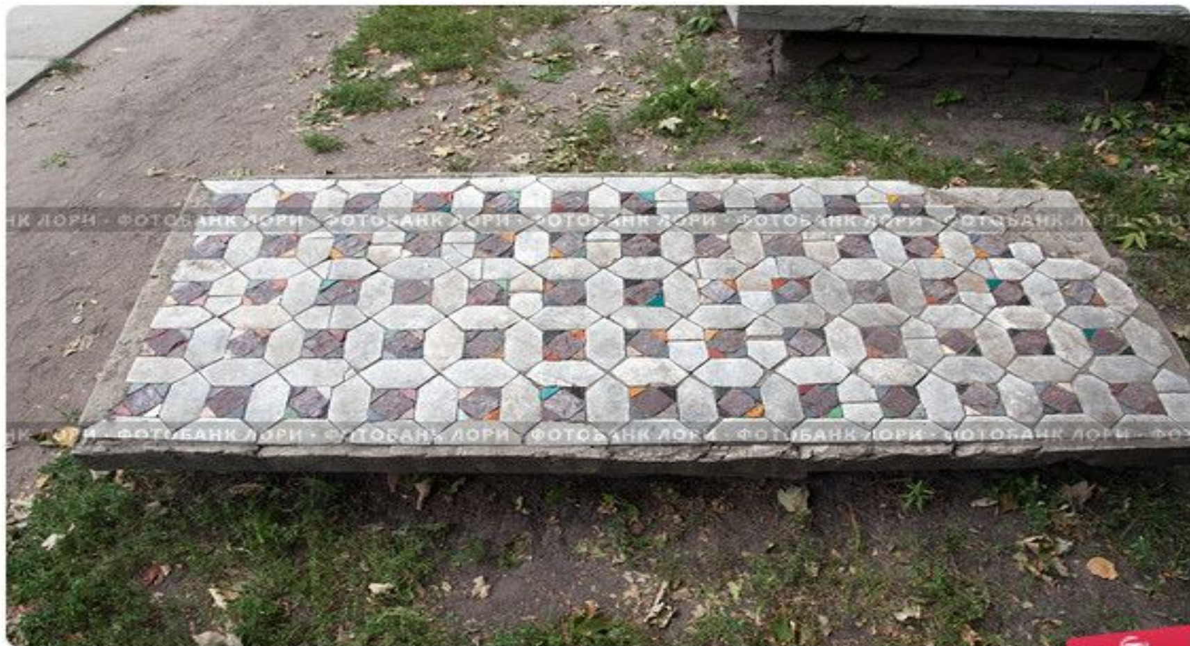
Киев, фрагмент напольной мозаики Десятинной церкви