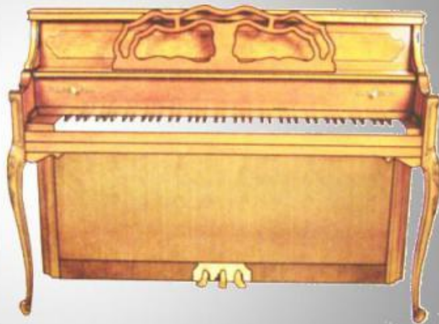
ФОРТЕПИАНО = ПИАНИНО