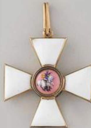
Знак 3-й степени