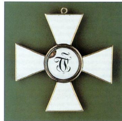
Знак ордена св. Георгия 3-й степени. Оборотная сторона. ВИМАИВС