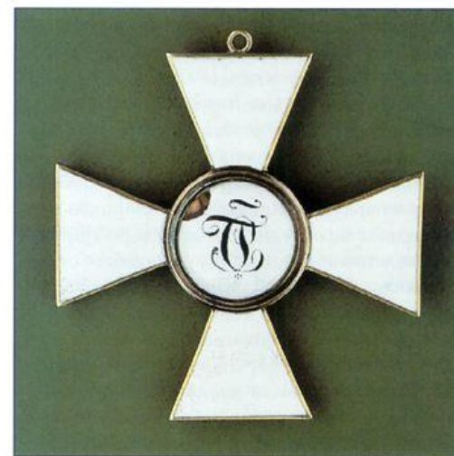
Знак ордена св. Георгия 3-й степени. Оборотная сторона. ВИМАИВС