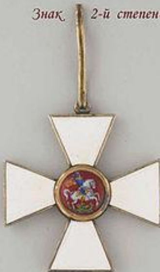
Знак 2-й степени