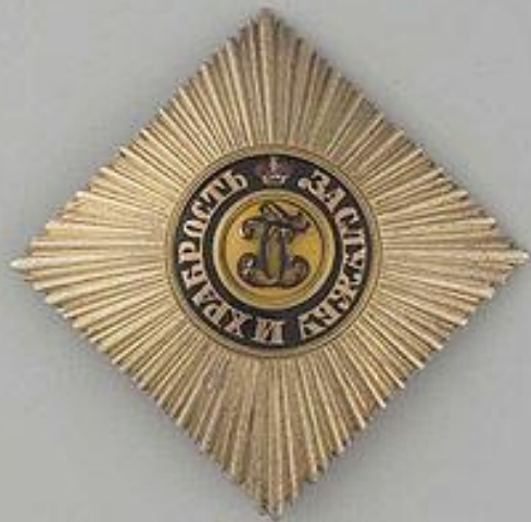
Звезда ордена Св. Георгия