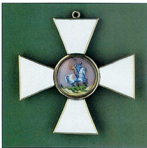
Знак ордена св. Георгия 3-й степени. Лицевая сторона. ВИМАИВС