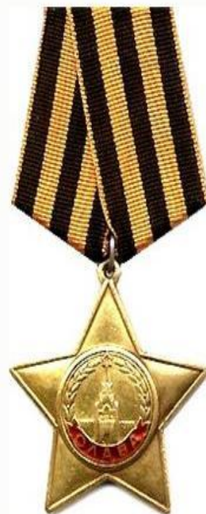
Орден Славы (СССР)