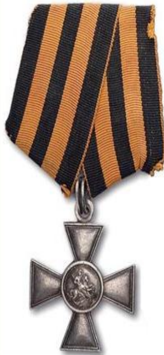
Орден Святого Георгия (Российская империя)