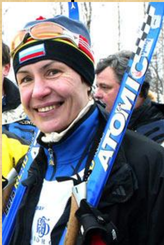
Егорова Любовь Ивановна 05. 05. 1966 г. Герой России