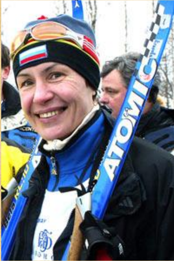
Егорова Любовь Ивановна 05. 05. 1966 г. Герой России