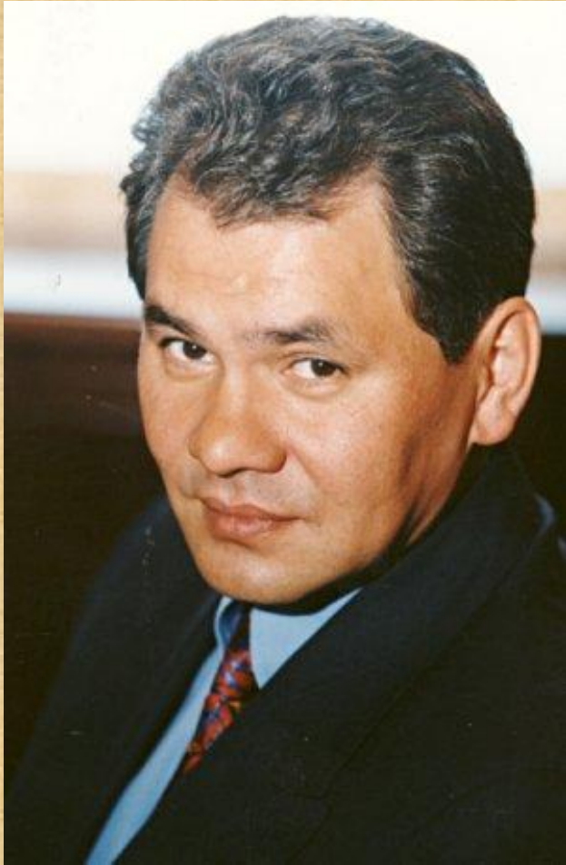
Шойгу Сергей Кужугетович 21. 5. 1955 Герой России