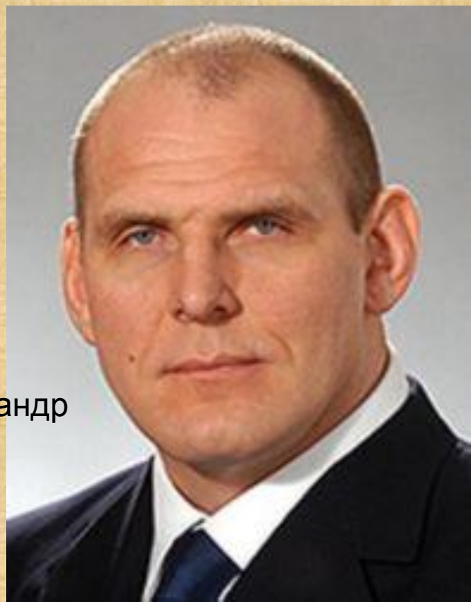
Карелин Александр Александрович 19. 09. 1967 Герой России