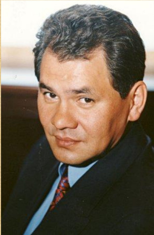
Шойгу Сергей Кужугетович 21. 5. 1955 Герой России