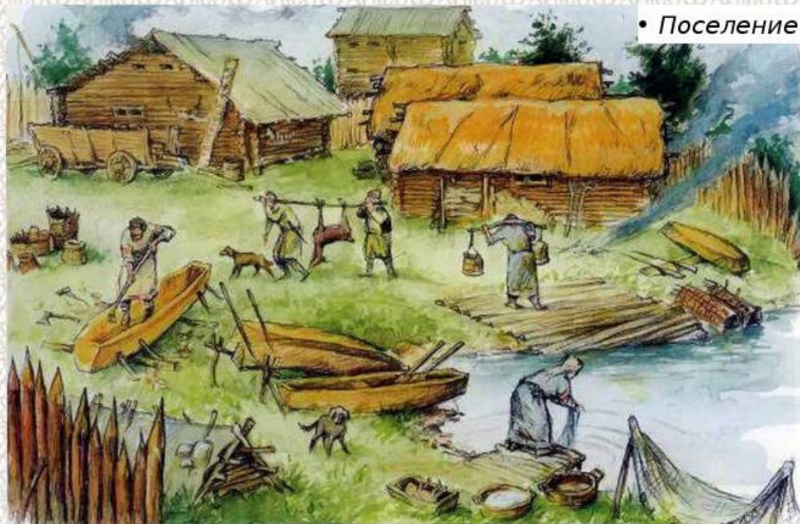
• Поселение славян

Селиться славяне любили по берегам рек и озер, на высоких местах — чтобы водой не залило во время весенних разливов. Тысячу лет тому назад не умели славяне строить хороших домов. Они сплетали себе жилища из ветвей, покрывали соломой — лишь бы укрыться от дождя да непогоды. — жили и в землянках.