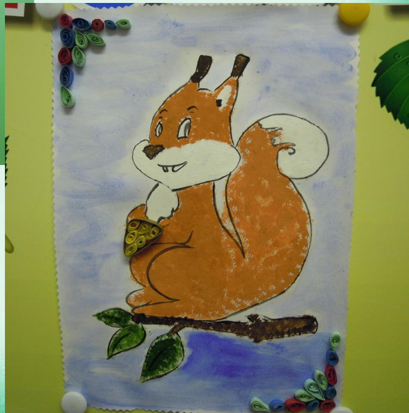
«Белочка с шишкой» (рисование сухой кистью + квиллинг)