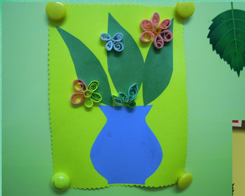
«Ваза с цветами» (аппликация с элементами квиллинга)