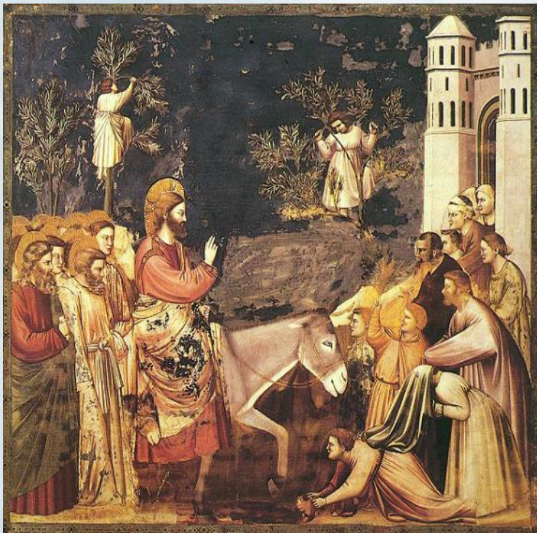
Джотто. Вход Господень в Иерусалим

Согласно Библии, В ЭТОТ день Иисус на молодом осле – символе кротости и миролюбия – торжественно въехал в ворота Иерусалима.