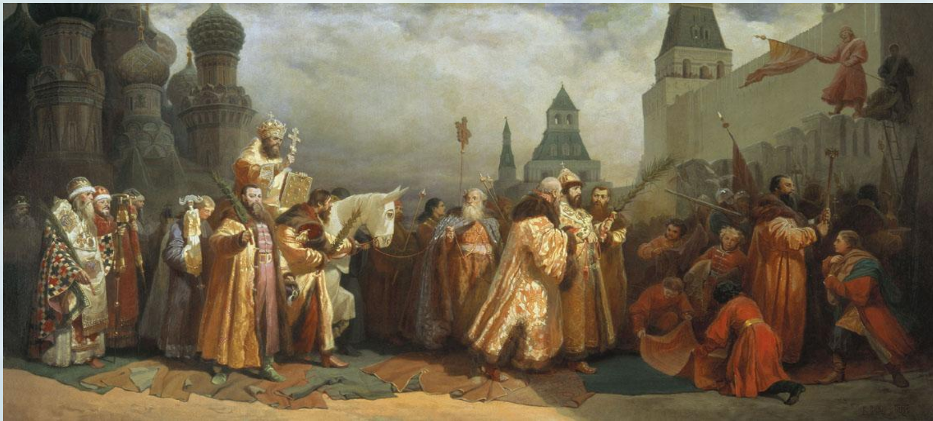
В. Г. Шварц «Шествие на осляти Алексея Михайловича» 1865.

На Руси в праздник Входа Господня в Иерусалим совершалось так называемое «шествие на осляти».