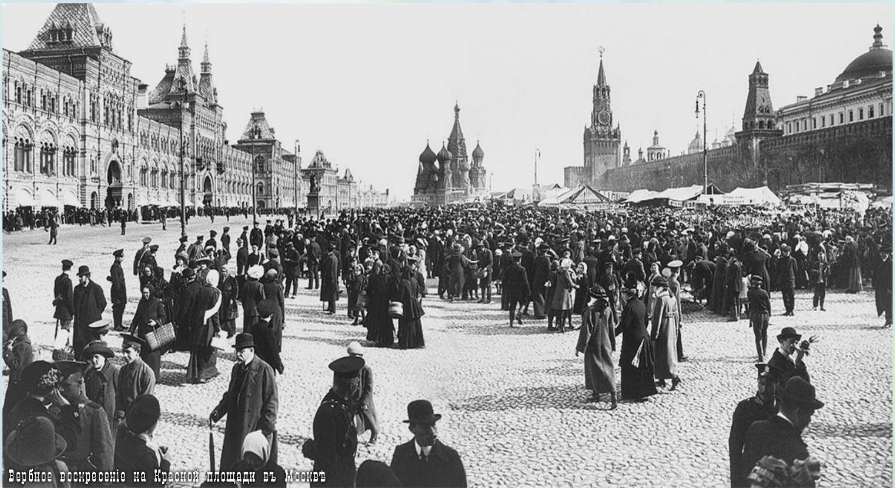
Вербное воскресенье на Красной площади в Москве

В Вербное воскресенье устраивались вербные базары, на которых можно было купить сладости, игрушки, книги, а также пучки вербы с привязанным к ним бумажными ангелочками.