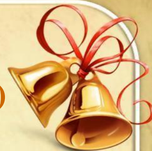
ТАБЛИЦА ТРЕБОВАНИЙ по русскому языку 1 класс (конец года)