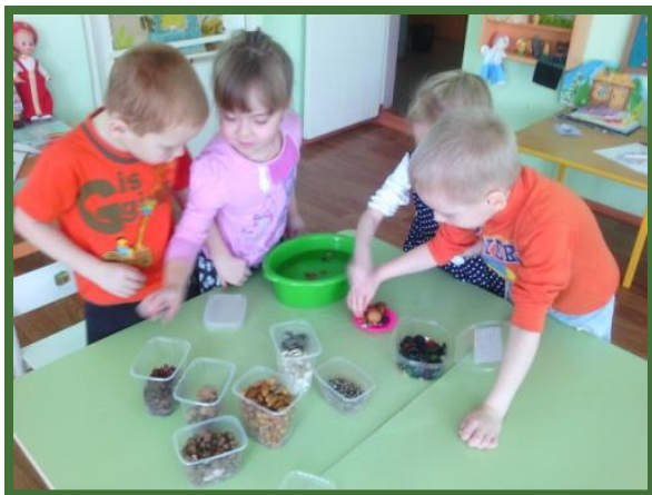
Кружок «Юный эколог»