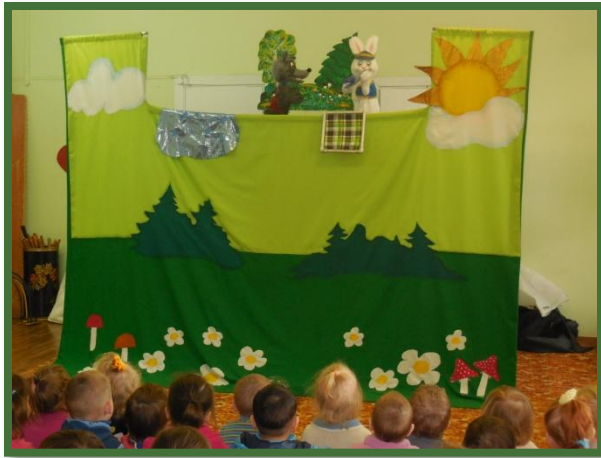
Театр у нас в гостях