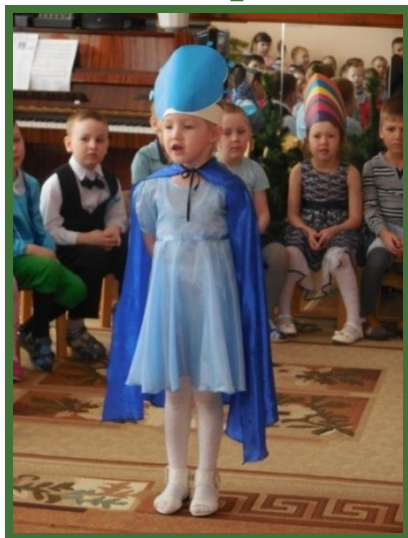
Театрализация «В гостях у Колобка»