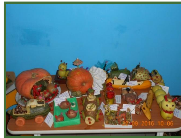
Выставка «Дары осени»