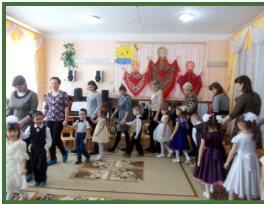
Вместе с мамами танцуем