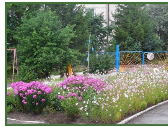
Уголок природы и экспериментирования