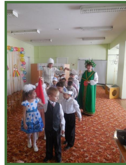
Театрализованное развлечение по сказке «Теремок»