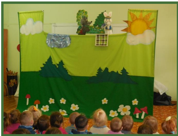
Театр у нас в гостях