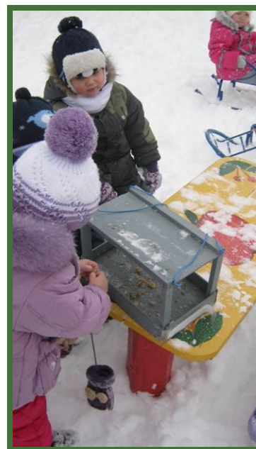
Акция «Покормите птиц»