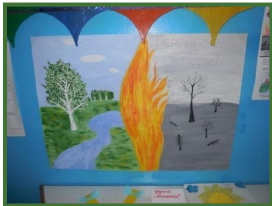
Плакат «Берегите лес от огня!»