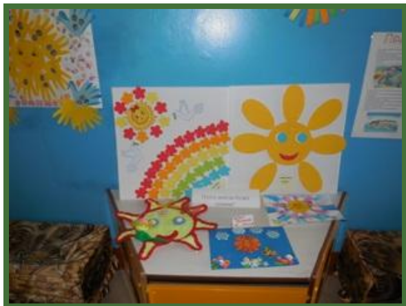
Выставка "Пусть всегда будет солнце!"