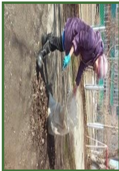
Субботники по уборке территории