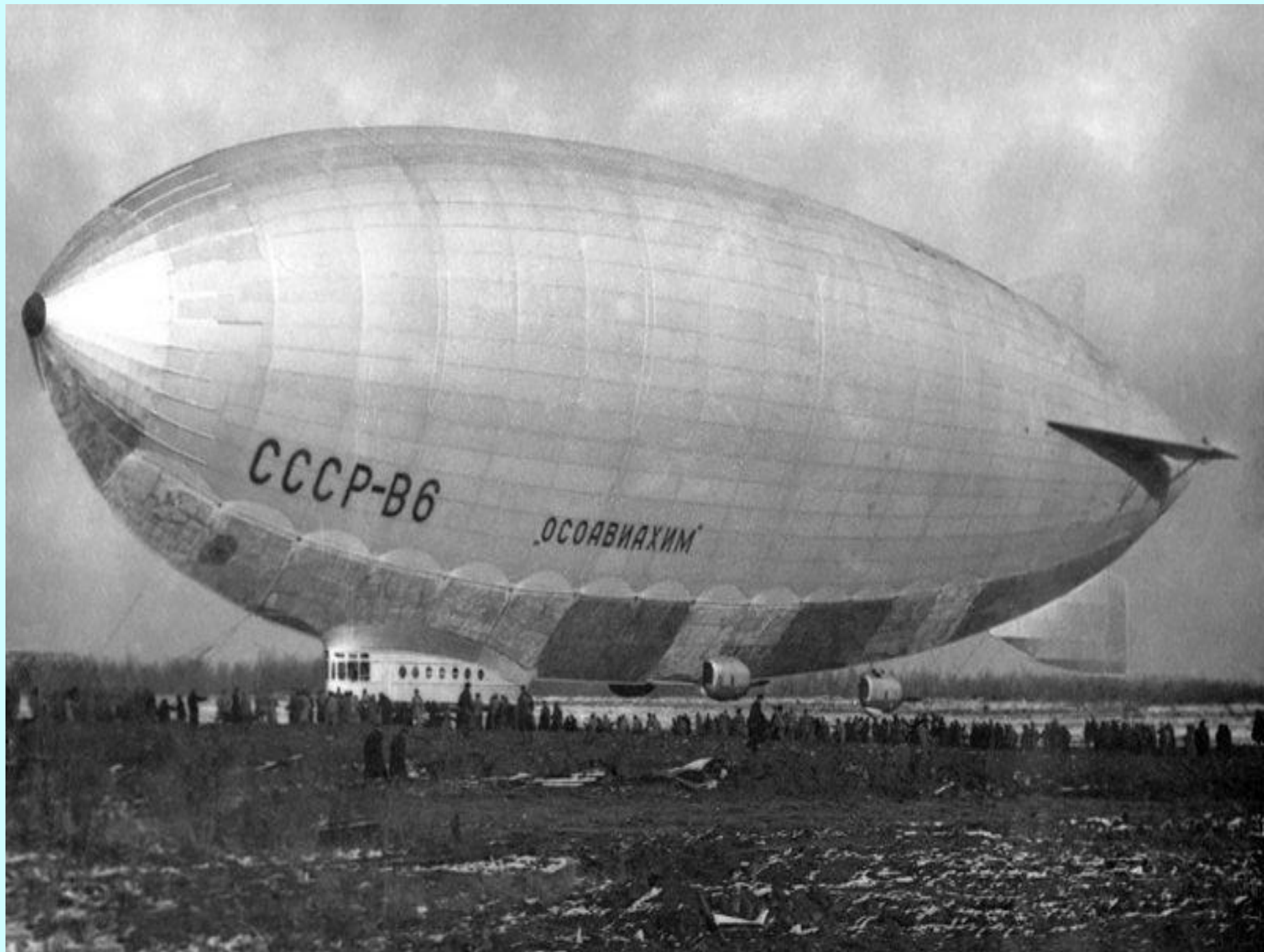
работу, а уже 7 ноября того же года построенным