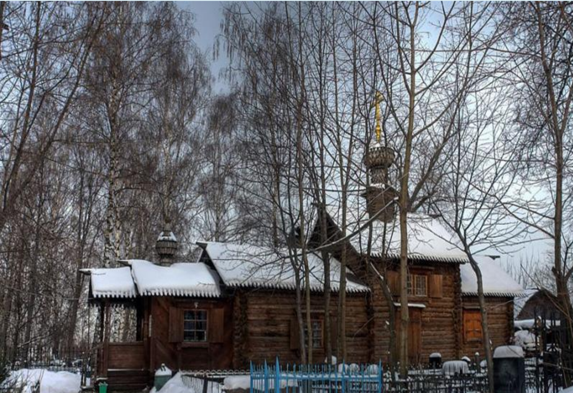
Храм Георгия Победоносца