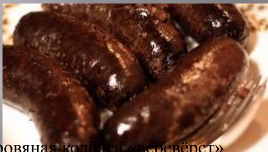
Кровяная колбаса «веревёрст»

Традиционная эстонская национальная кухня сформировалась во многом под влиянием немецкой кухни. Таллинские рестораны предлагают вам широкий выбор блюд и других национальных кухонь: вас ждут итальянские, китайские, индийские рестораны и даже ресторан со средневековой кухней!