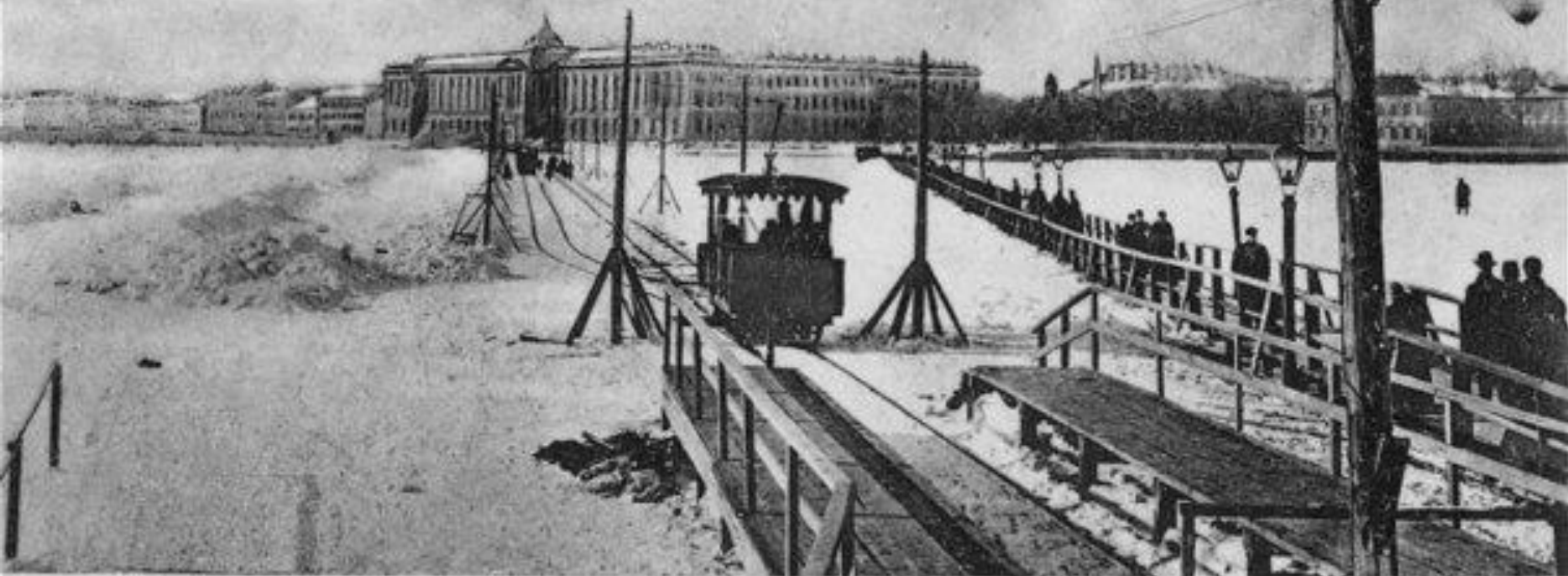
Электрическая дорога черезъ Неву