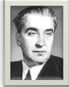
Виктор Влади́мирович Виногра́дов (1894 – 1969)

Большинство заимствованных фразеологизмов являются дословным переводом иностранных выражений: быть не в своей тарелке (франц.), звезда программы (франц.), синий чулок (англ.), темная лошадка (англ.), утечка мозгов (англ.) и т.д.