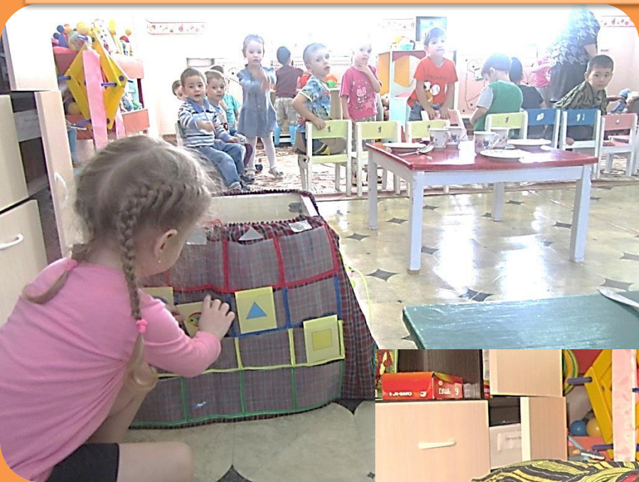
Игра «найди дом фигуре»