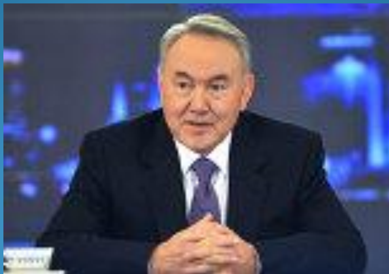
Қазақстан Республикасының тұңғыш Президенті Нурсұлтан Абишұлы Назарбаев