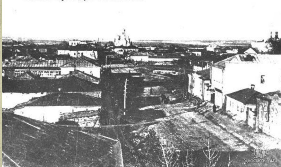
Новохоперск, ул. Московская.

Таким образом, выдвинутая мною гипотеза полностью подтвердилась. Улицы города имели раньше другое название. Новохоперск и сейчас сохранил старинную планировку. Это тихий провинциальный городок с многочисленными памятниками архитектуры и зелеными улицами.