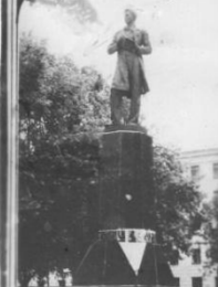
ПАМЯТНИК Г. ТУКАЕВУ