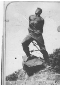
ПАМЯТНИК МУСЕ ДЖАМИЛОВУ