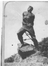
ПАМЯТНИК МУСЕ ДЖАМИЛОВУ