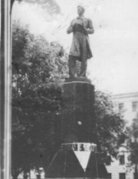
ПАМЯТНИК Г. ТУКАЕВУ