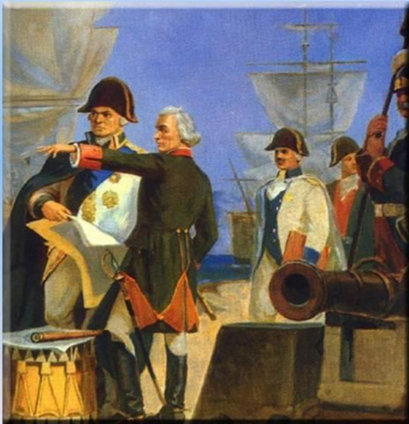
А.В.Суворов и Ф.Ф.Ушаков

В период царствования Екатерины II Россия вела продолжительные войны, в первую очередь за выход к Чёрному морю. В этой войне русскими войсками руководили А. С. Суворов и Ф. Ф. Ушаков.