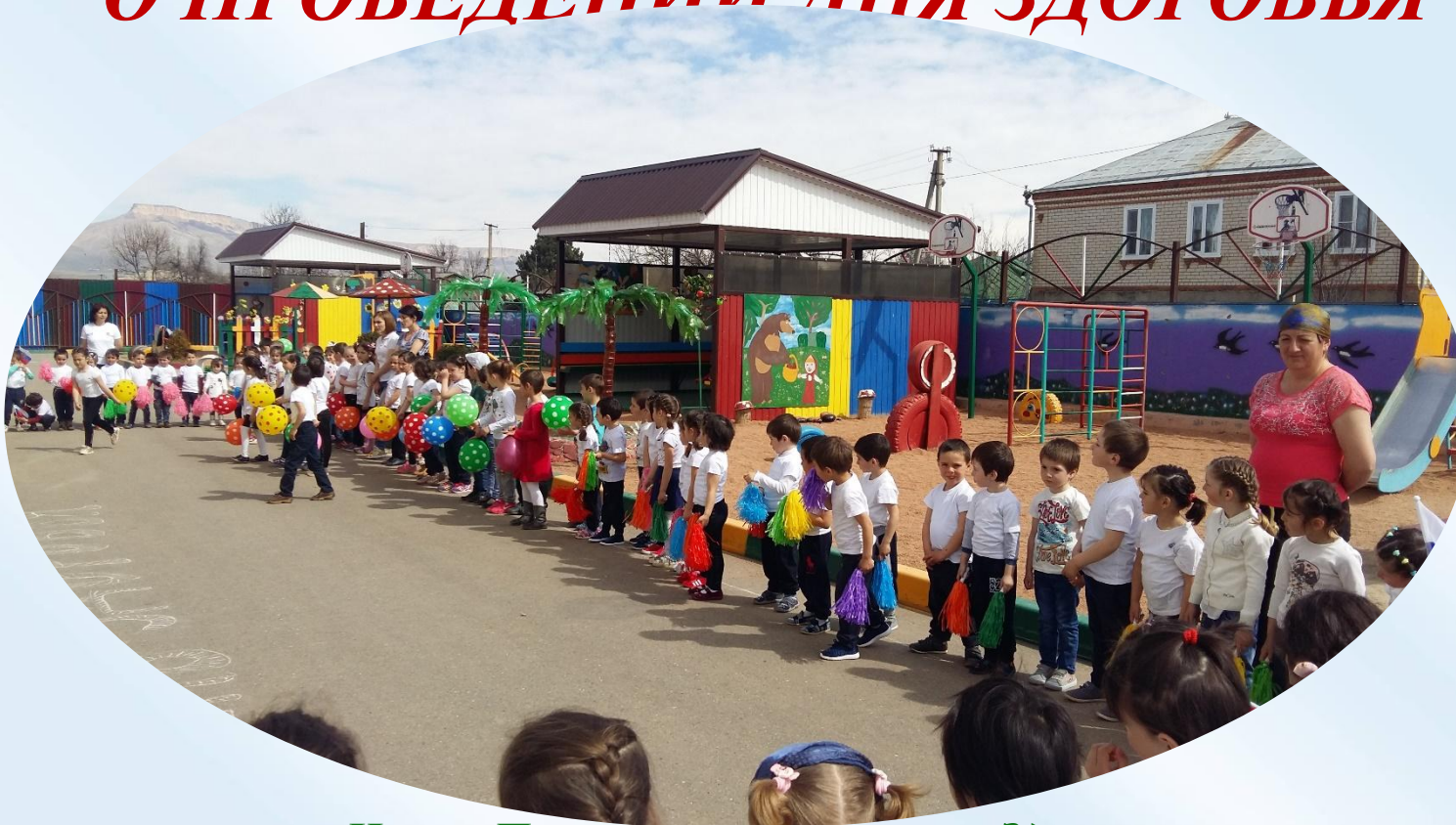
Игра «Путешествие в страну Здоровья»