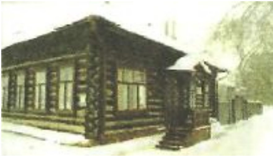
Дом-музей П.П.Бажова в Екатеринбурге

В Москве есть улица Бажова, а рядом с бажовской — Малахитовая. На ВВЦ можно видеть фонтан «Каменный цветок». Есть даже теплоход «Павел Бажов». На родине Бажова в Сысерти и в Екатеринбурге работают музеи П.П. Бажова, ему поставлены памятники.