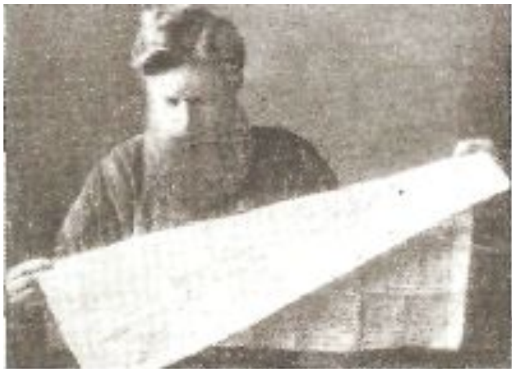
П.П.Бажов читает крестьянское письмо

Одновременно с учительской работой Павел Петрович много занимается изучением фольклора и этнографии, истории родного уральского края. К этому же времени относится и его первая публикация в «Екатеринбургских епархиальных новостях». События революции и Гражданской войны не оставили Бажова в стороне. Он вступает в Красную Армию, а после войны становится журналистом.