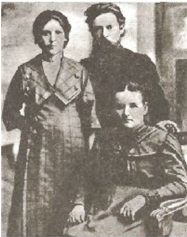
Бажов с матерью и женой