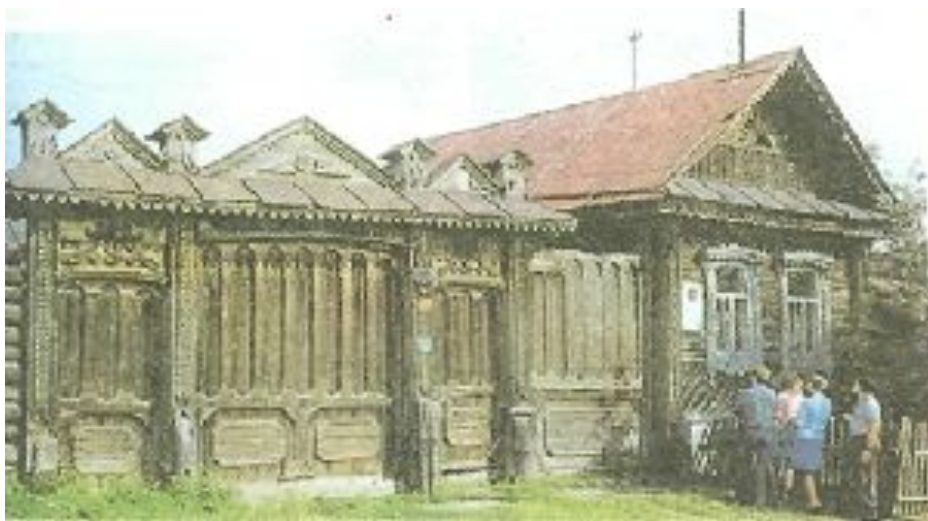
Дом П.П.Бажова в Сысерти

Павел учился в земской трёхлетней школе. Был способным и любознательным учеником. Родители, люди небогатые, всё же нашли возможность продолжить обучение сына в уездном городе — Екатеринбурге.