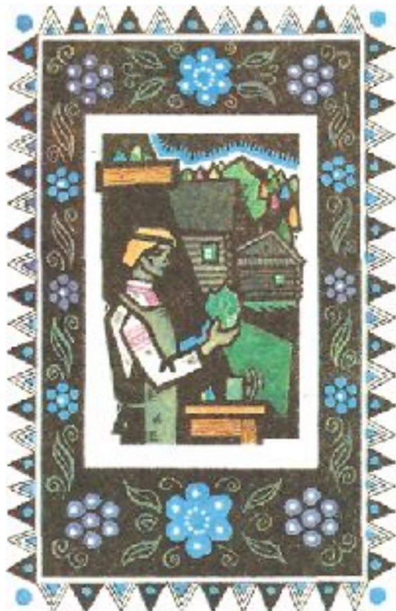
Данило-мастер. Художник А.Белюкин

Сказ — устное слово, устная форма речи, перенесенная в книгу.