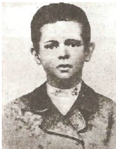
Бажов в детстве