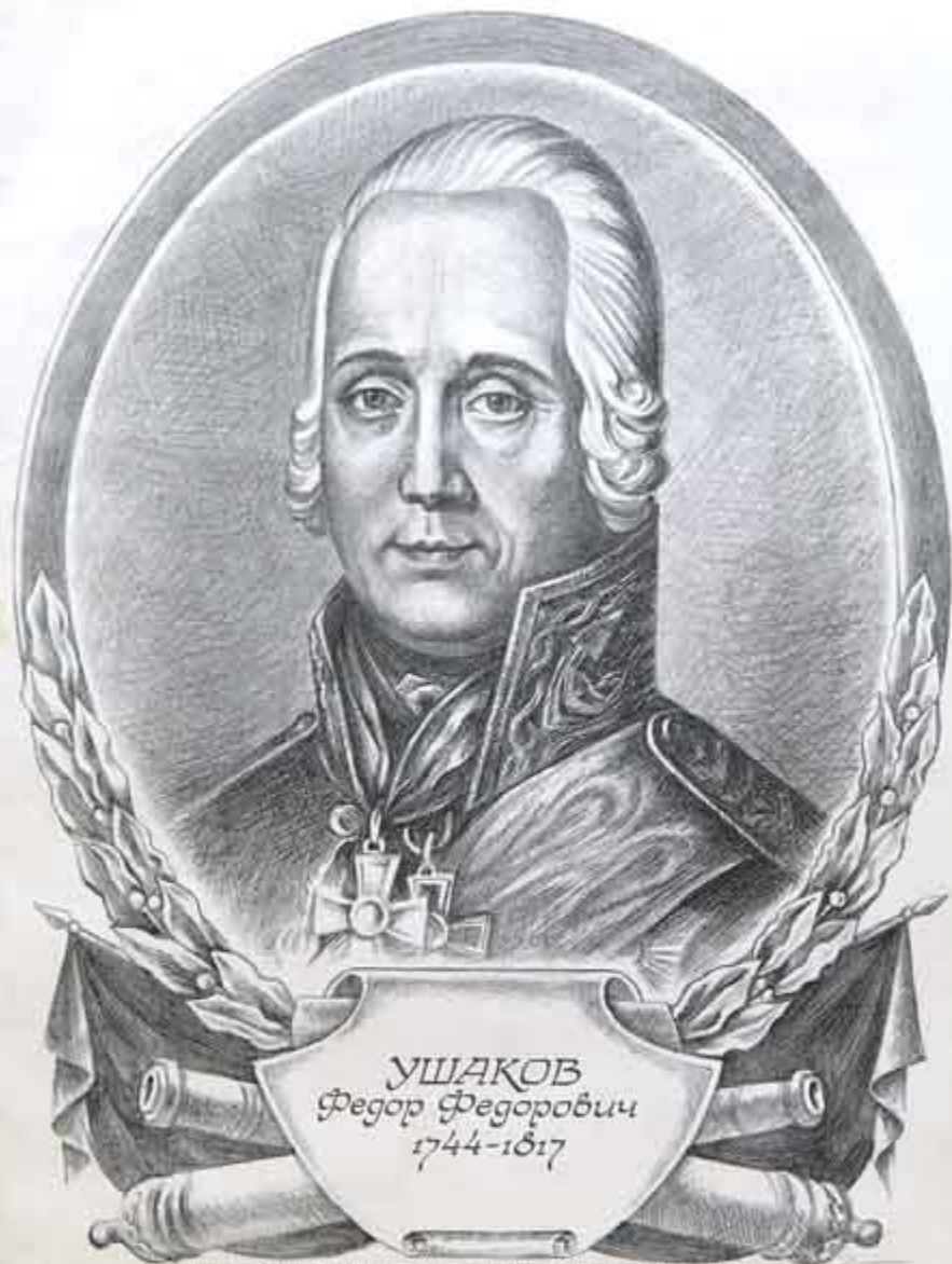
Самостоятельный флотоводец, адмирал, один из создателей Черноморского флота и с 1790 г. его командующий. Произвел ряд прогрессивных изменений в военно-морском искусстве. Разработал и применил тактику «паруса», одержав при этом ряд критич. побед над турецким флотом. В 1804 г. в СССР учрежден орденом и медалью Ушакова.