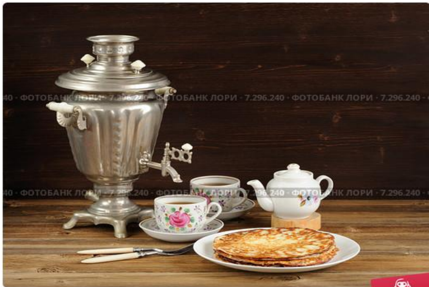
Русские блины в тарелке, самовар, две чашки чая, две вилки, за