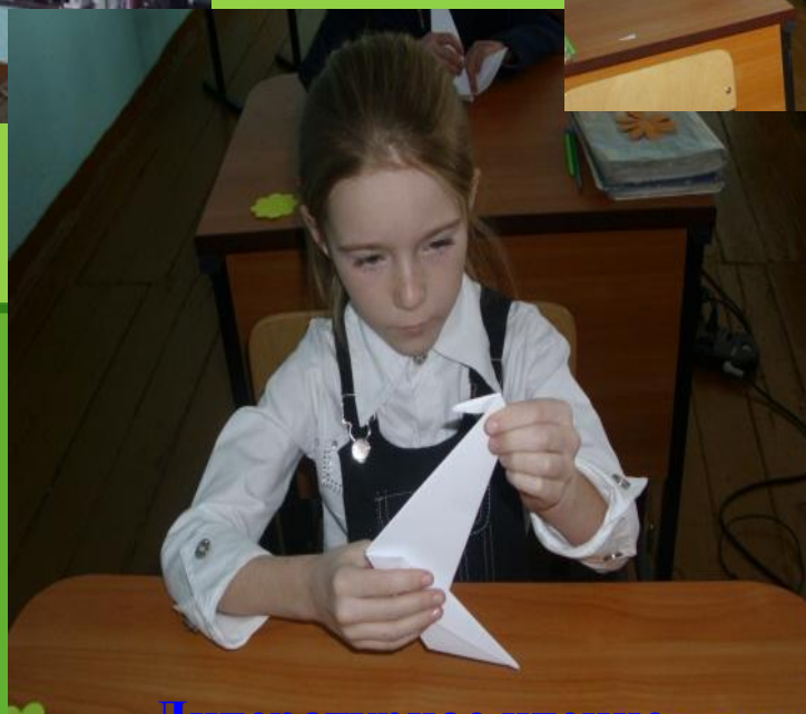
Литературное чтение Ю. Яковлев «Белые журавлики»