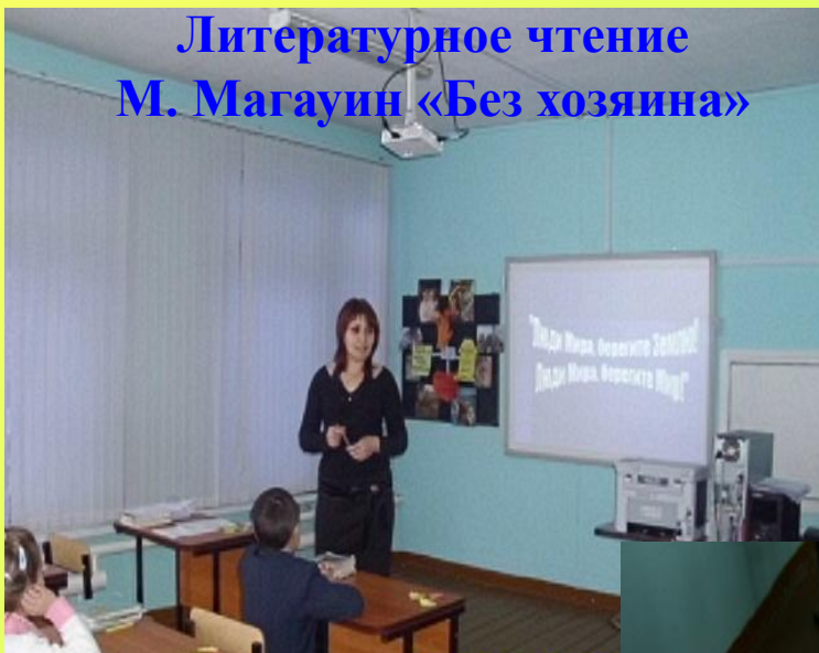
Литературное чтение М. Магауин «Без хозяина»