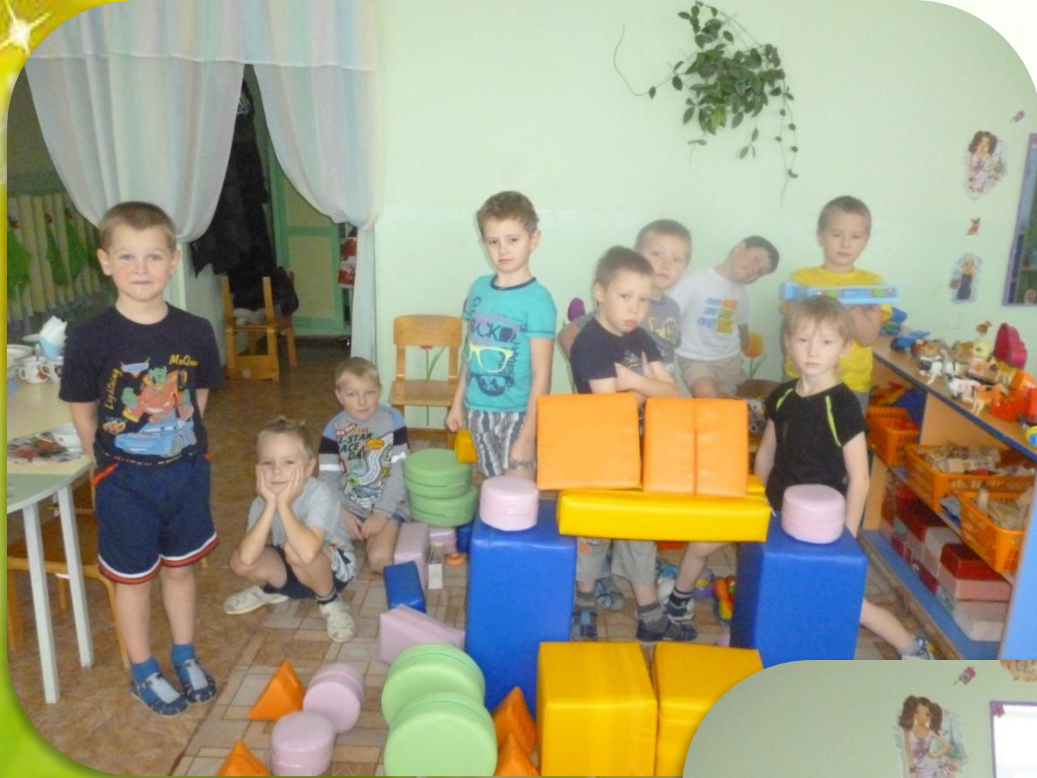
Это наши мальчики!