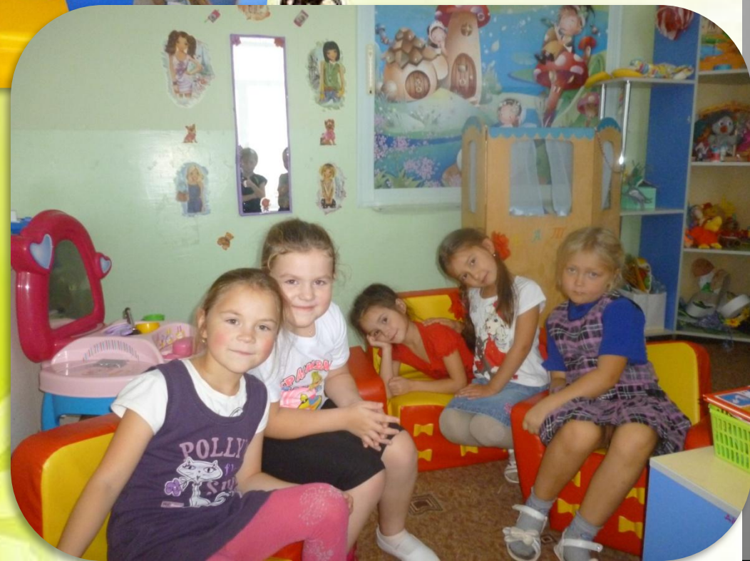
Это наши девочки!