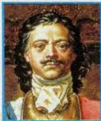
При Петре Великом

1. Когда произошли эти события? Соедини стрелками.