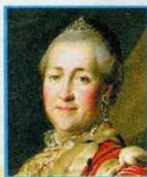
При Екатерине Великой

Открытие народных училищ и Воспитательного дома.