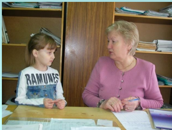
Сармановское сельское поселение