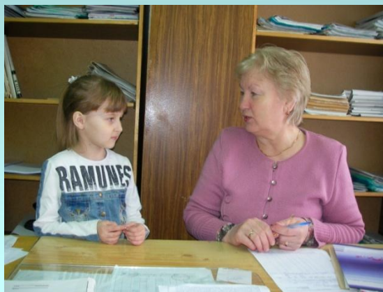
Сармановское сельское поселение