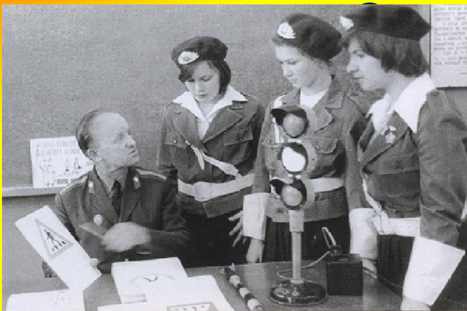
Изучение правил дорожного движения членами школьного отряда юных инспекторов движения