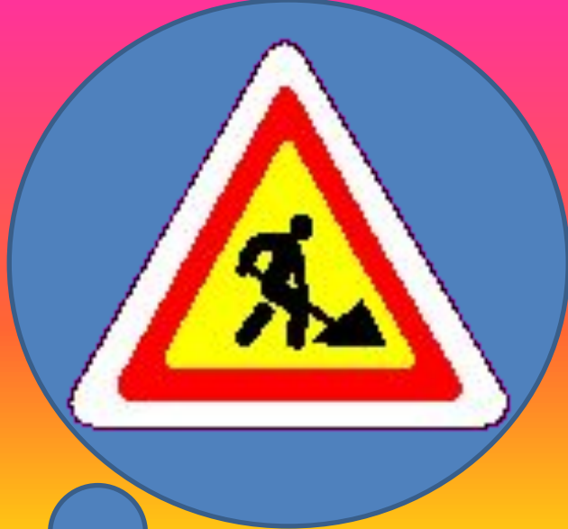
Знак «Дорожные работы»