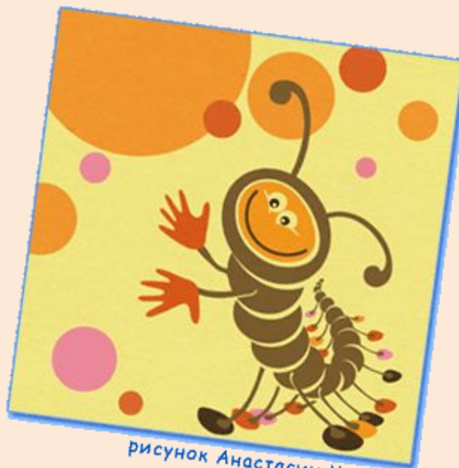
рисунок Анастасии Ухиной

Мастерская под замком - Так и ходит босиком.