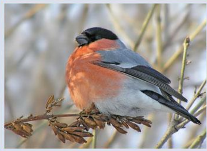
Громко вторят снегири.