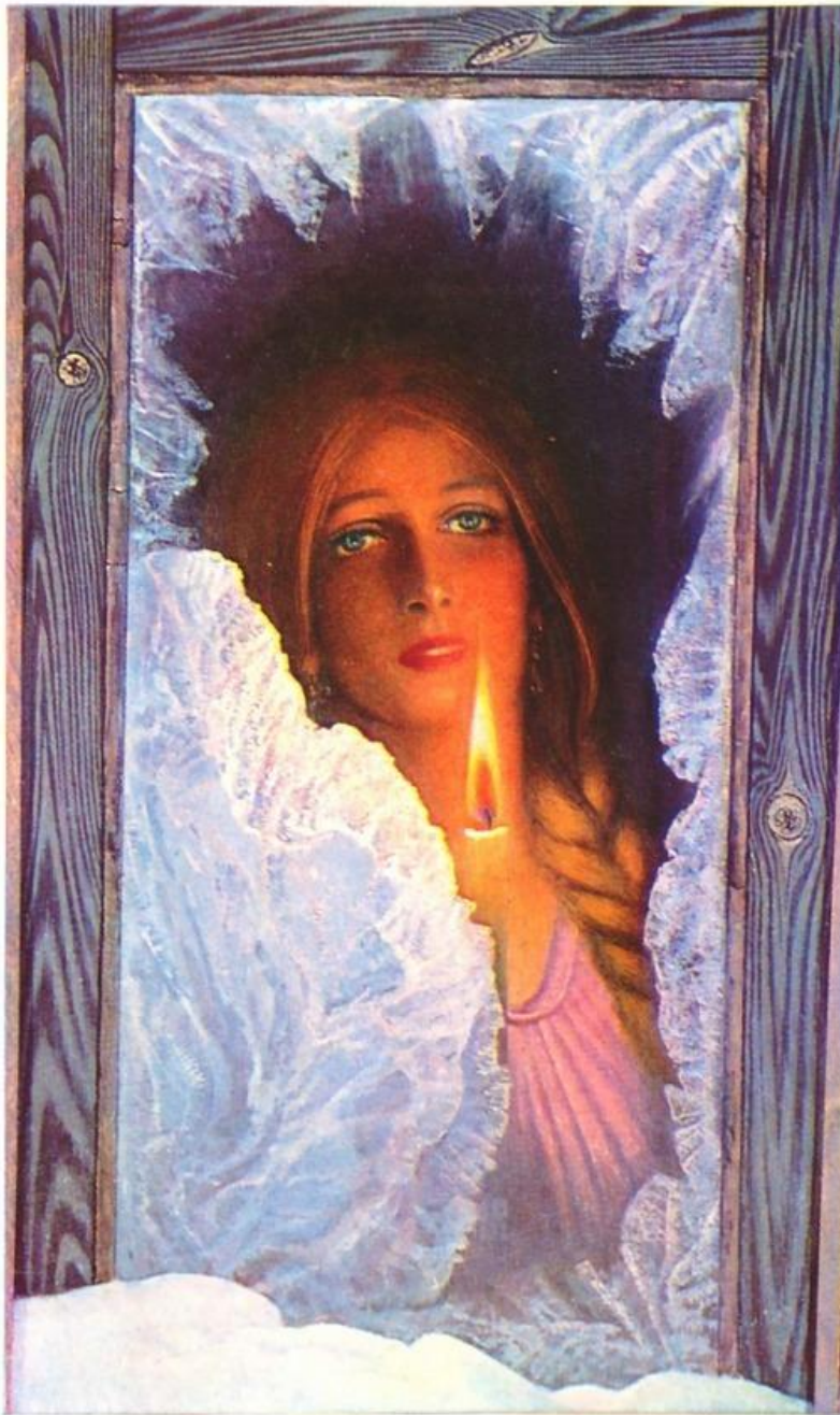
«Ожидание» Константин Васильев