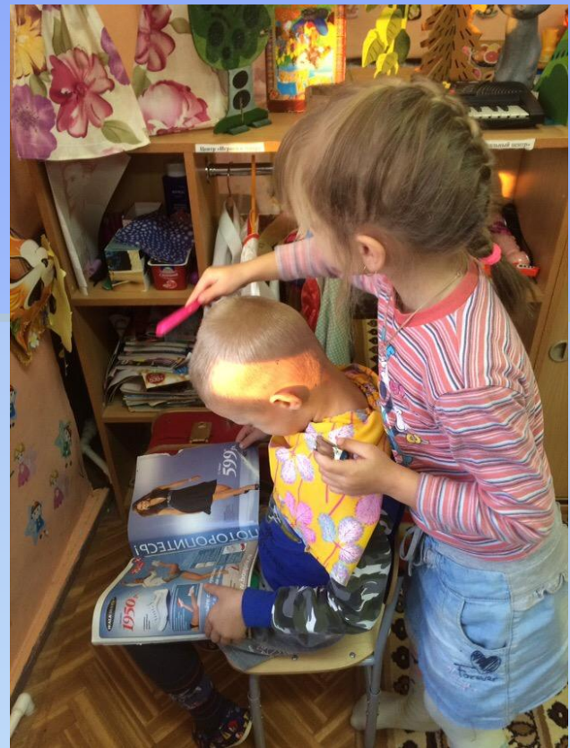
Помощь в превращении