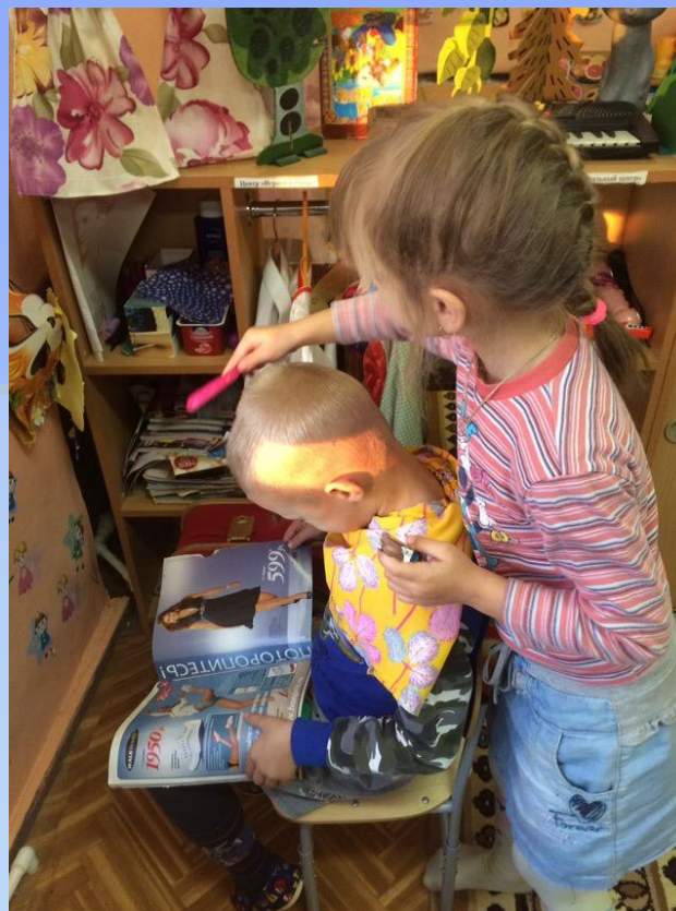
Помощь в превращении