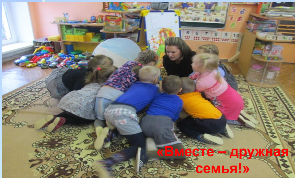
«Вместе – дружная семья!»