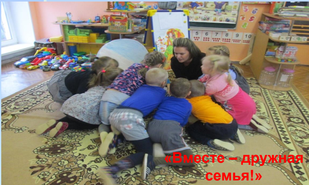
«Вместе – дружная семья!»