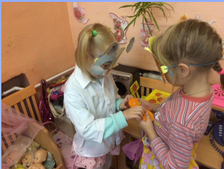
Сочинение историй-сценок с костюмами