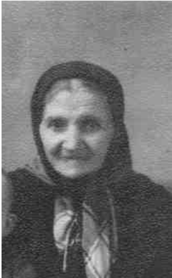
Демкова Наталья Федоровна (1872 – 1962)