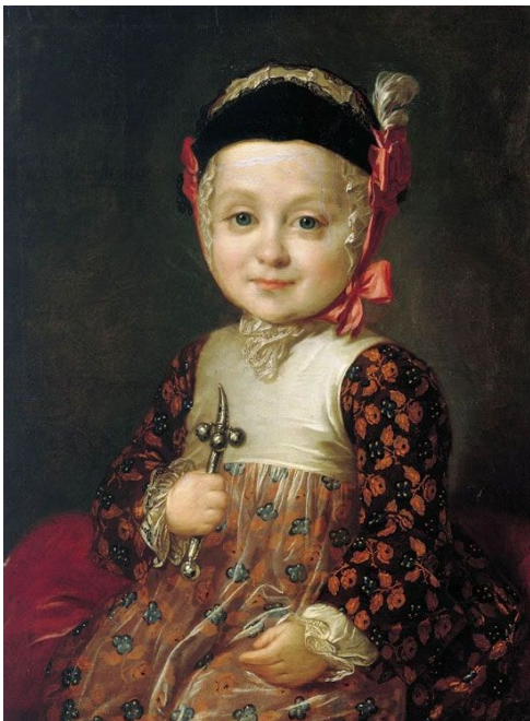
Портрет графа Бобринского в младенчестве, 1763 Федор Рокотов (1736 – 1809).

Портрет великого князя Александра Павловича неизвестного художника конца 1770-х г., ГИМ, Москва