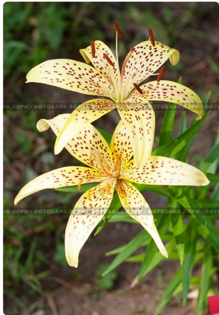
Дикie лилии - саранки

Сибирская легенда повествует о том, что лилия-саранка выросла из сердца казачьего атамана Ермака, погибшего при завоевании Сибири, и тот, кто прикоснётся к ней, станет смелым и мужественным. На территории Бийского района растёт в окрестностях сёл Верх-Катунское, Сrostки, Усть-Катунское, у г. Бийска. Факторы, приводящие к исчезновению вида: истребляется в результате выкапывания луковиц (обладающих питательными и лекарственными свойствами) и сбора цветов на букеты.