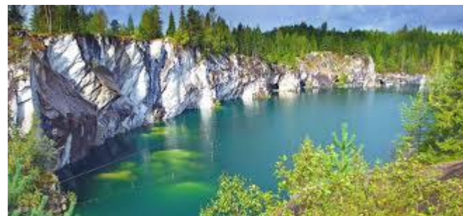
Горный парк РУСКЕАЛА