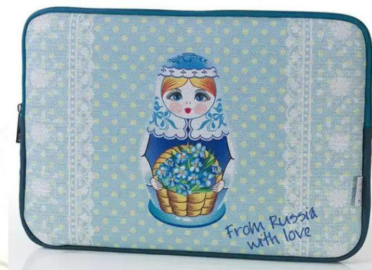
Чехол для планшета