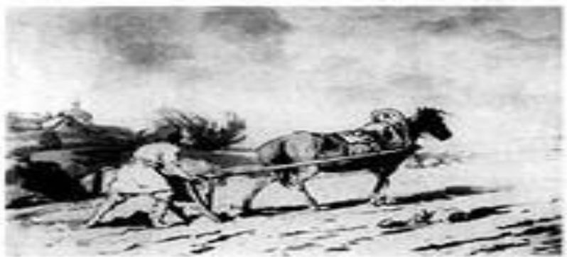
С. Д. Алмазов. Пашушкой крестьянин. Раскрасочная графика (рис. Зинаида).