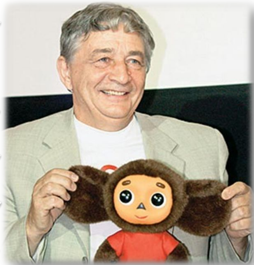
Эдуард Успенский Род. 1937 г.