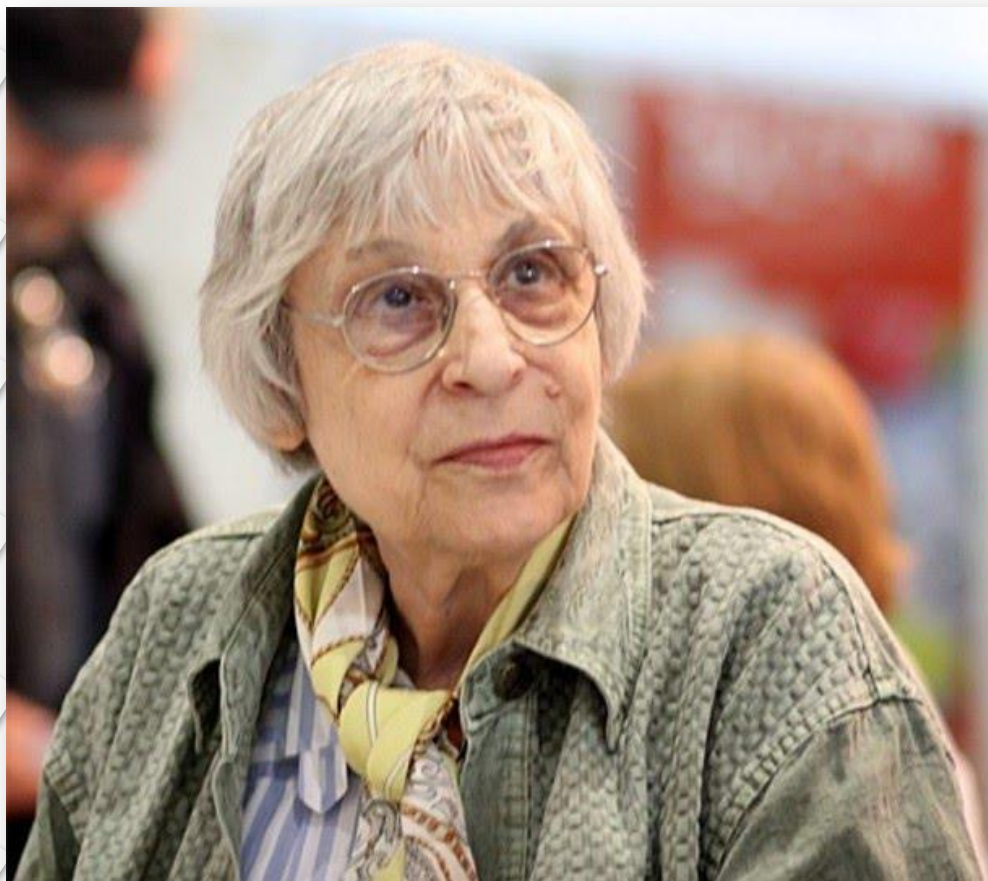
Юнна Мориц Род. 1937 г.