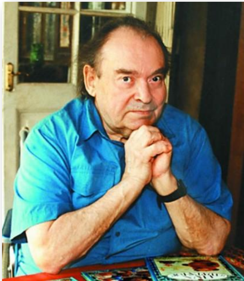
Борис Заходер 1918 - 2000