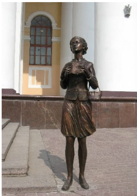
Калужская «театралка» - скульптура С.И. Фарниевой