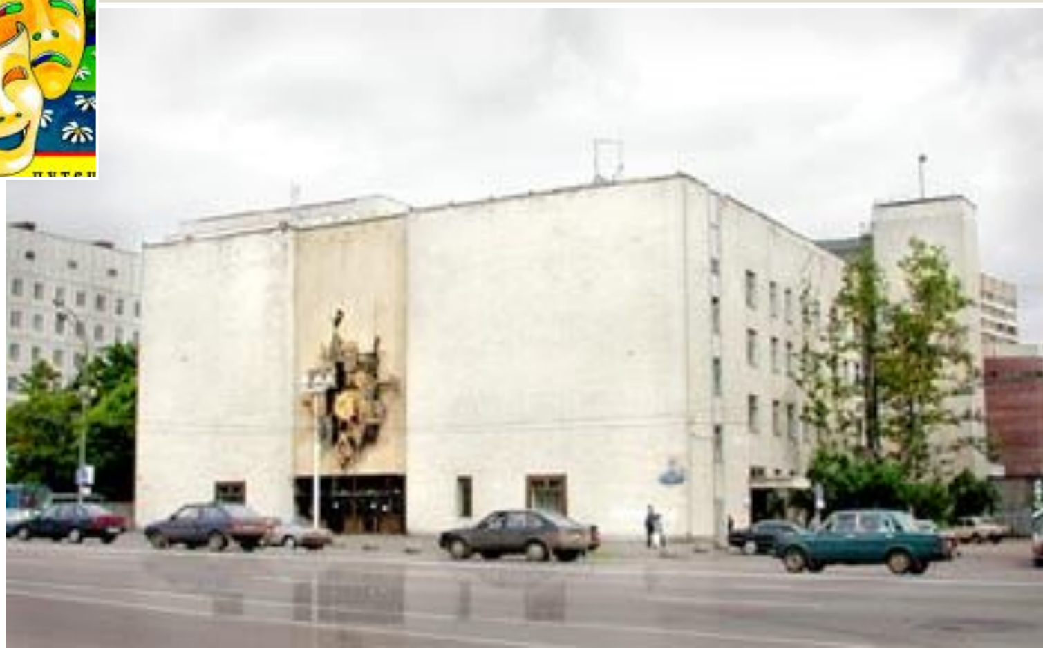
ТЕАТР КУКОЛ имени С.В. ОБРАЗЦОВА