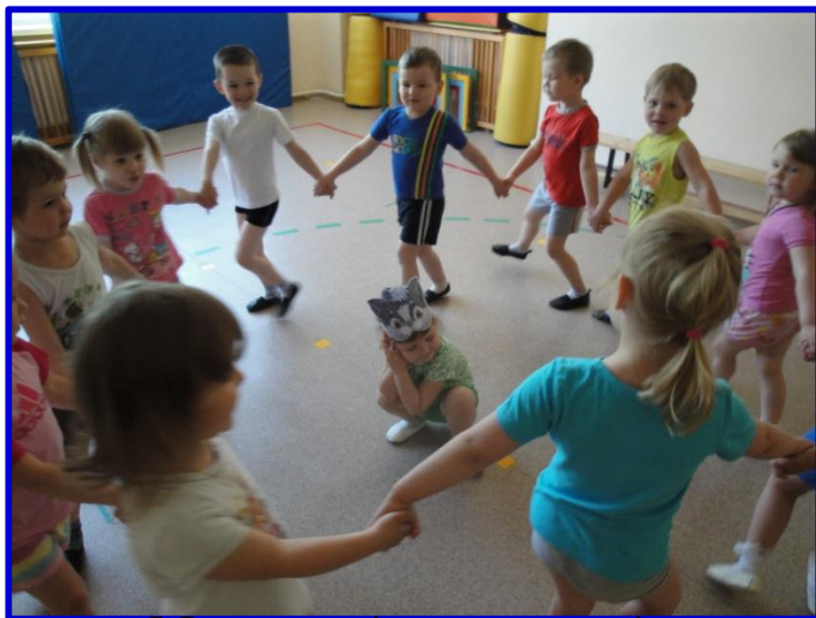
«Мыши водят хоровод, На лежанке дремлет кот»