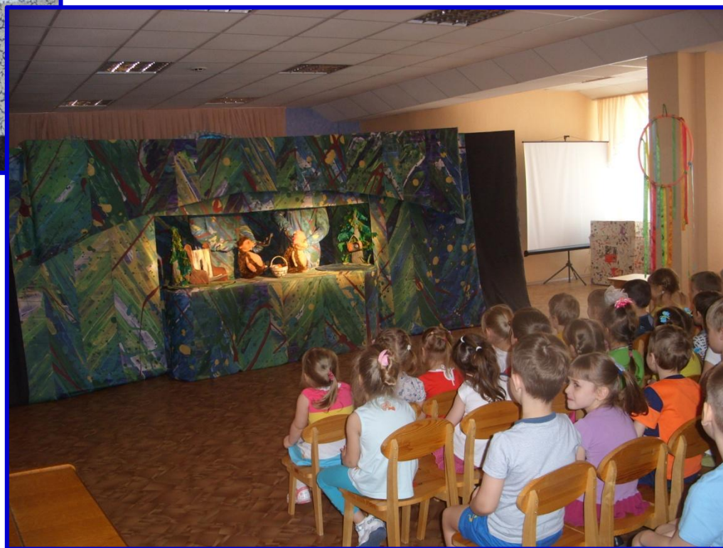
«Муха – Цокотуха» (театр «Страна сказок»)