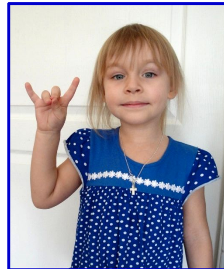
«Идёт коза рогатая...»