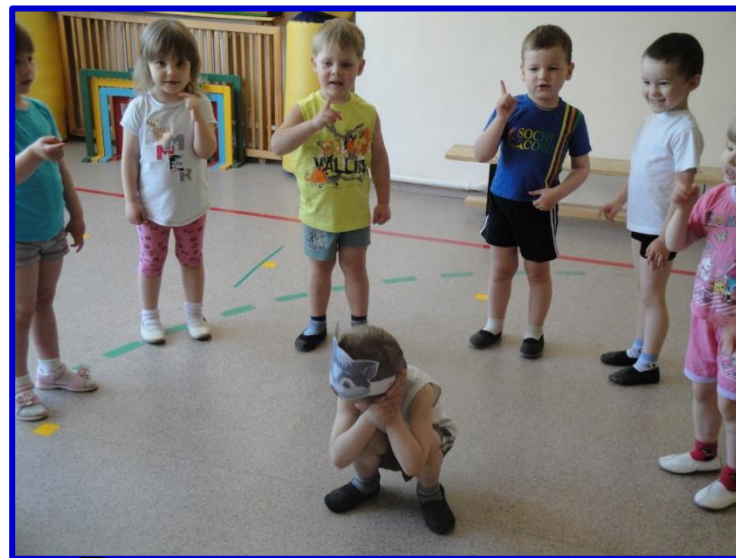
«Тише, мыши, не шумите, Кота Ваську не будите!»