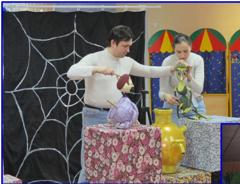
«Необыкновенное состязание» (театр «Кузнечик»)