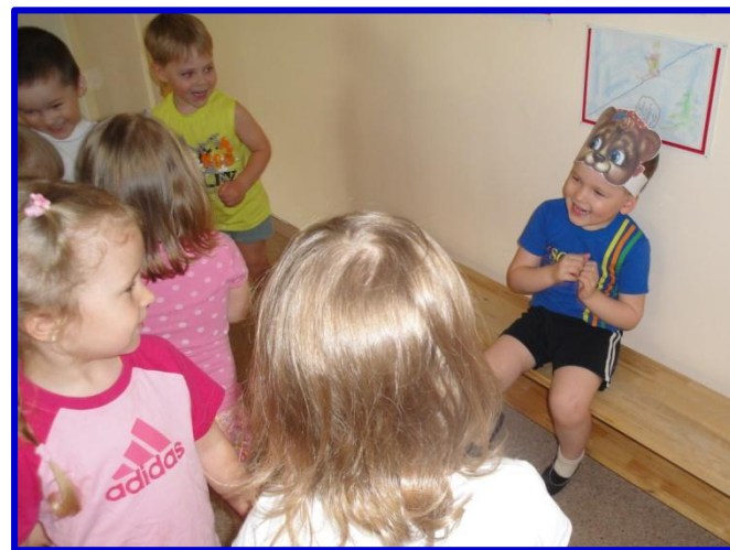
«А медведь не спит, Всё на нас глядит...»