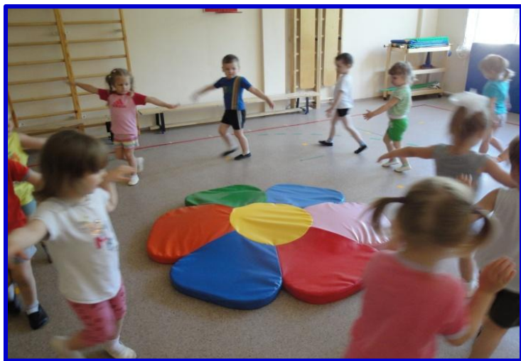
«Бабочки порхали, Крыльями махали»