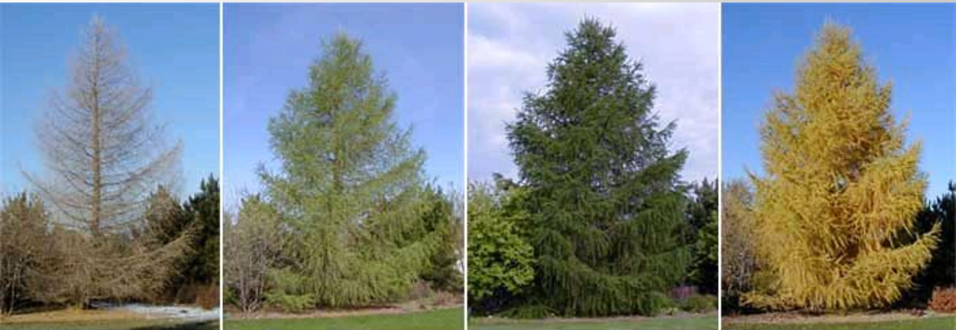
Лиственница европейская: 4 времени года - Larix decidua

Лиственница – тоже хвойное дерево. Но она сбрасывает свои иголки осенью и стоит всю зиму голая. А весной у неё вырастают новые иголки.