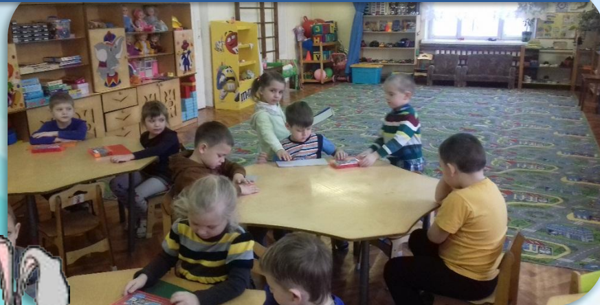
Дежурство по занятиям