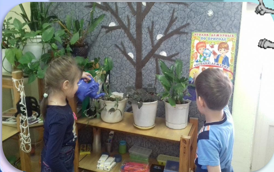
Дежурство в уголке природы