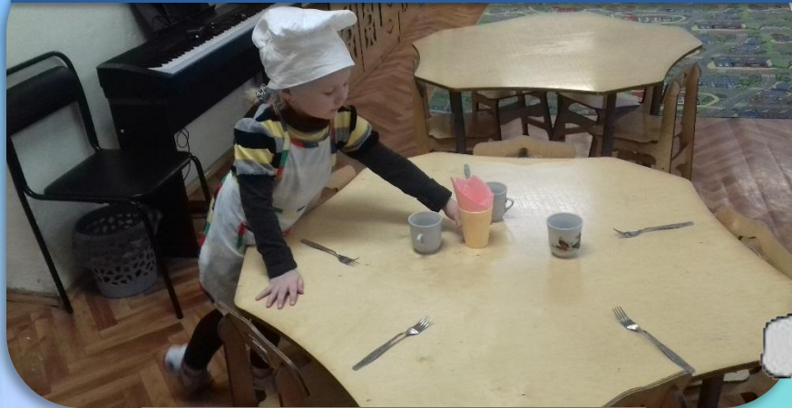
Дежурство по столовой

Различные виды труда способствуют развитию трудовых навыков и умений, воспитывают положительное отношение к труду. Это реализуется в следующих направлениях: дежурство по столовой; дежурство в уголке природы; дежурство по занятиям; ручной труд; коллективный труд на участке.