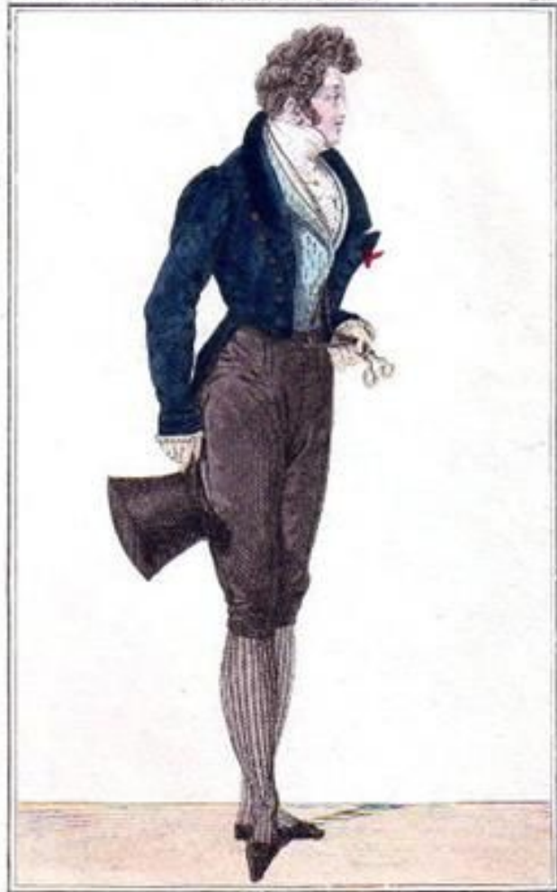
Petit Courrier des Dames Rue de Metz N o 25.

Le dit de Drop, gilet de Velours Noir en drap et soie de Valenciennes de M. Langouste. L'habit de deux boutons N o 27. Celui de deux boutons à jour; d'acier à boutons.