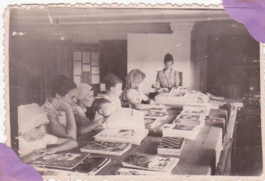
В воскресенье с книгой