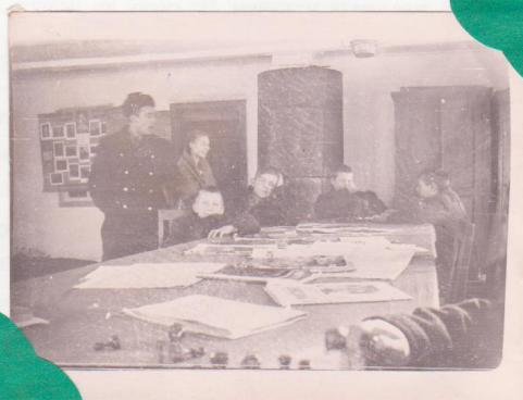
Пятиминутка с механизаторами