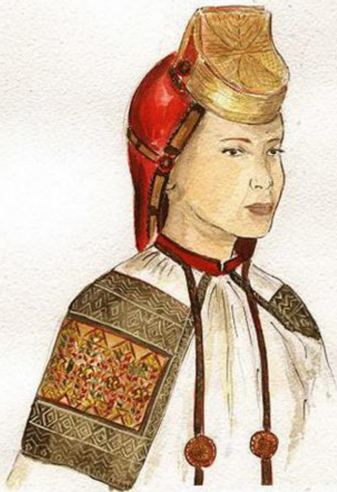
Головной убор "сорока". Воронеж конец 19 начало 20 века. (сукно, бархат, золотное шитьё, гапун)