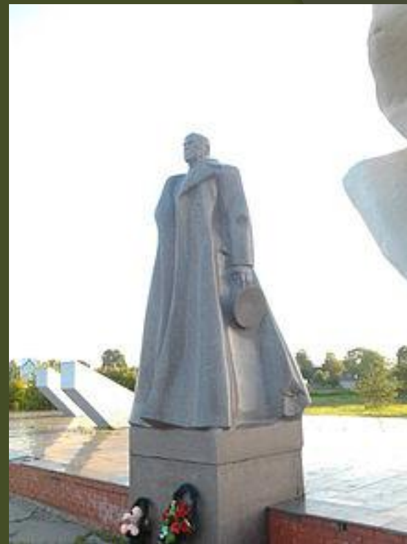
Мемориал на родине в деревне Стрелкова