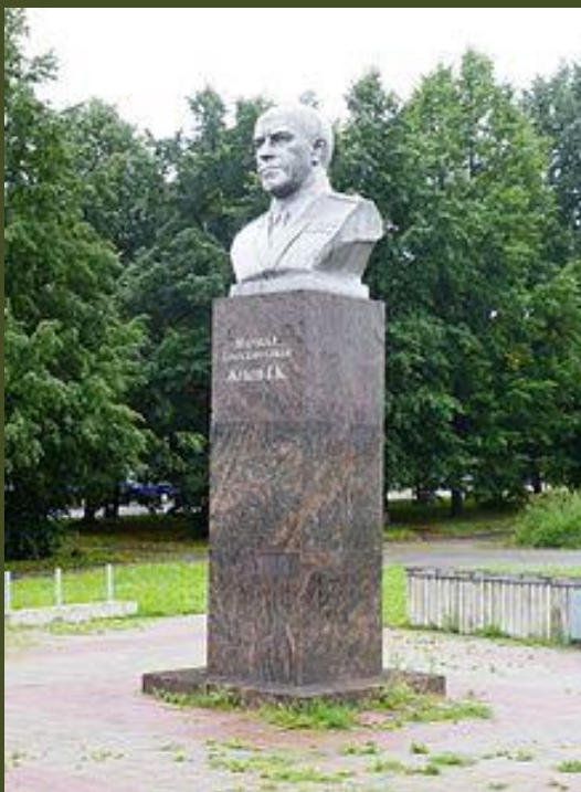
Бюст Маршала Жукова в Петрозаводске