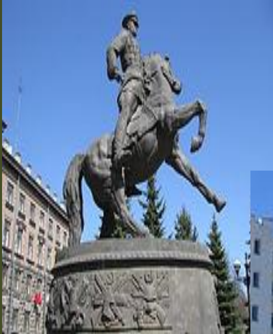
Памятник Жукову в Екатеринбурге