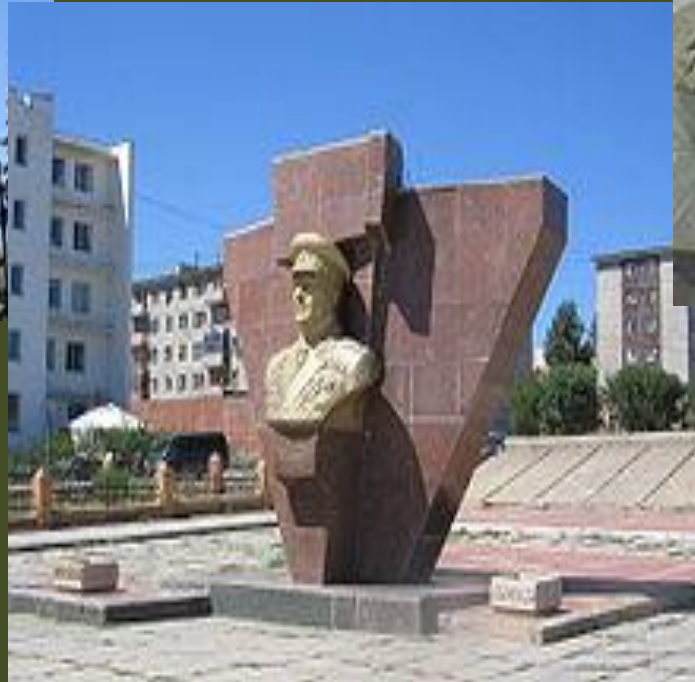
Памятник Жукову в Улан-Баторе