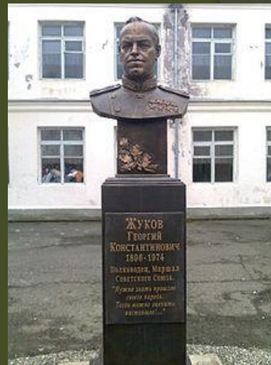
Бюст Маршала Жукова в Крымске