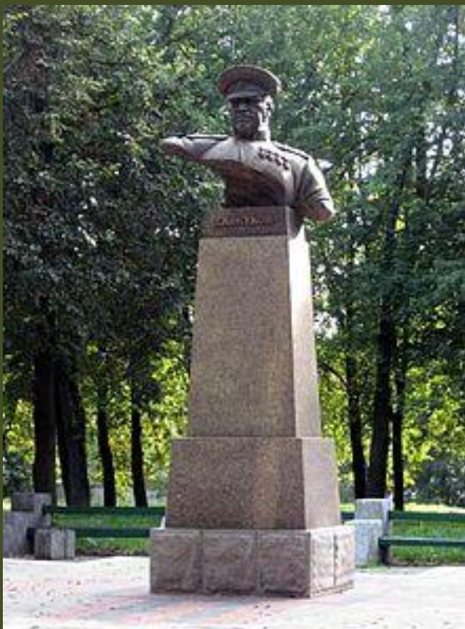
Памятник Жукова в Минске