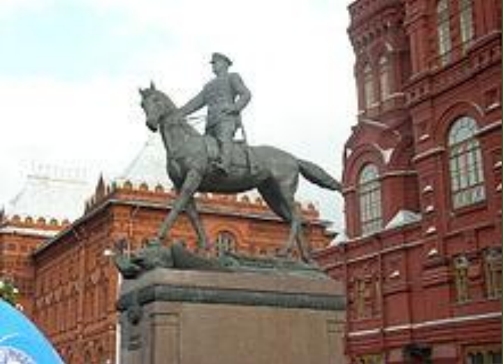
Памятник Жукову в Москве