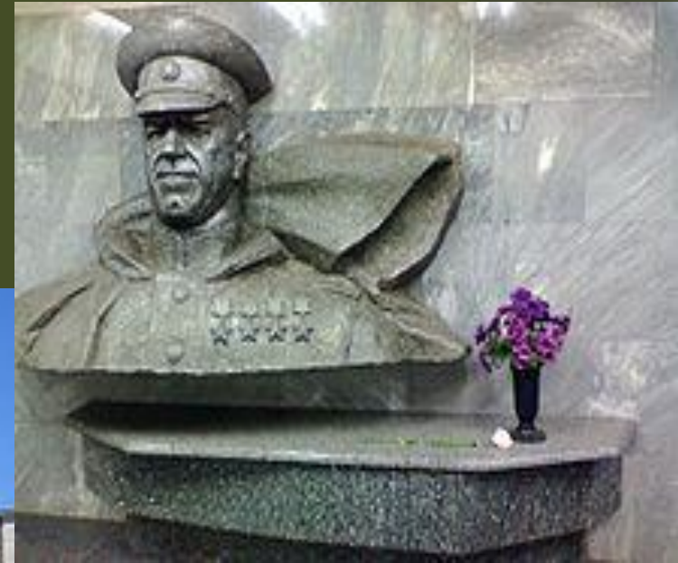
Бюст Жукова (метро Харьков)